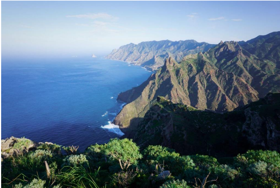
Península de Anaga, Tenerife

El puerto de salida es Marina San Miguel, en la Isla de Tenerife.